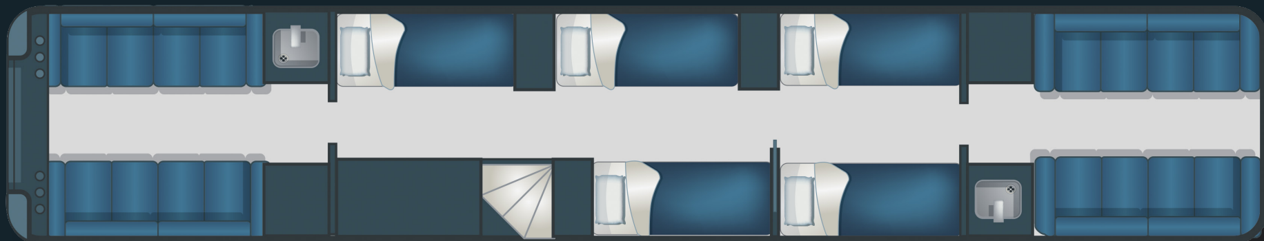
Schéma des équipements